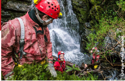
Luc-Henri Fage - Sony / JBB / Photos

En présence du réalisateur VEN 15 - 14H30